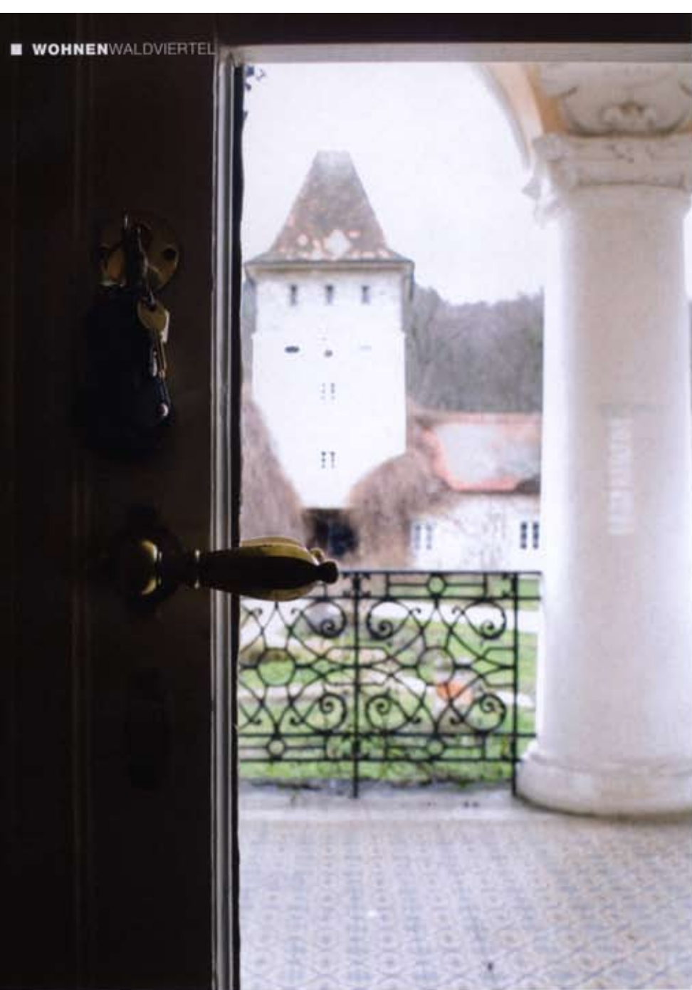
Ausgang. Türschlösser und Beschläge stammen aus dem 19. Jahrhundert und sind – wie fast alles – in den Originalzustand versetzt worden. Durch die Scheibe der Eingangstür sieht man den Innenhof und den Glockenturm